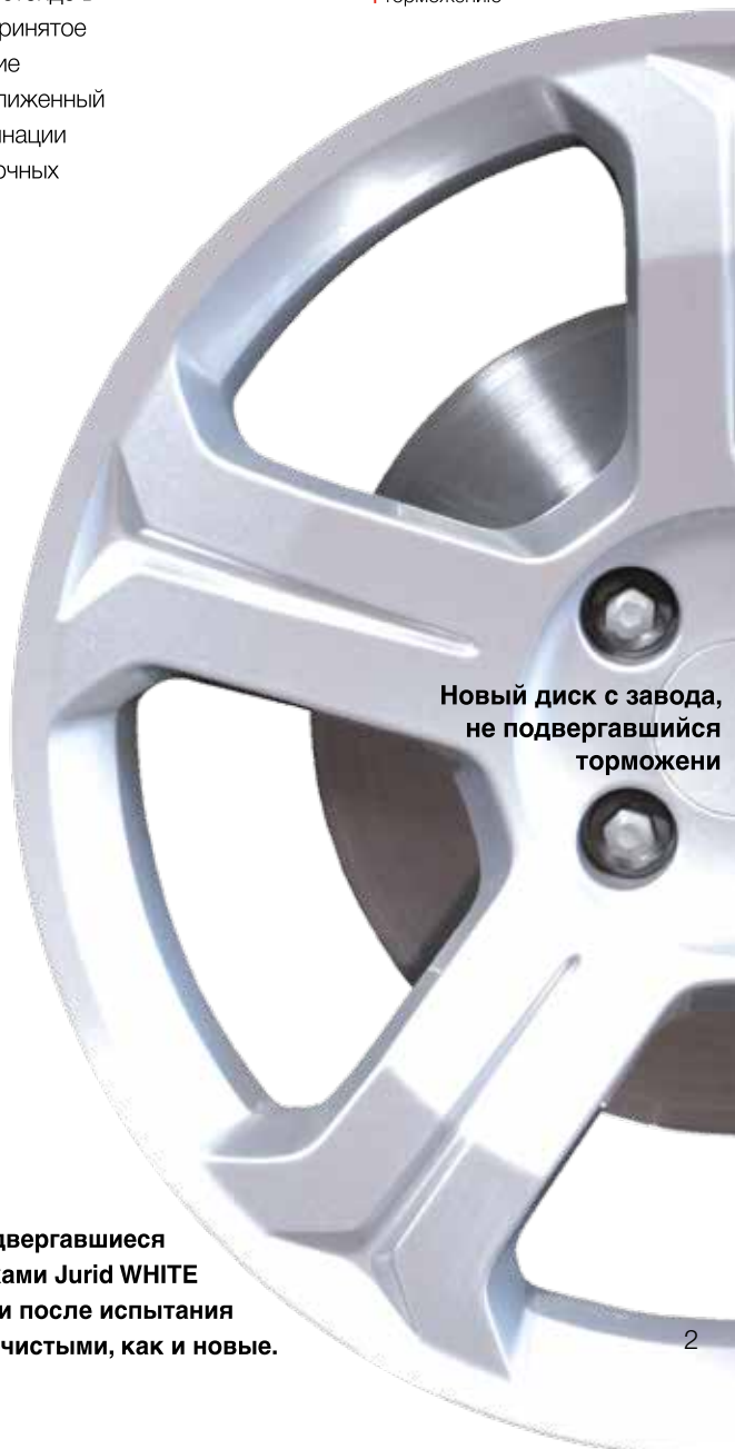
Новый диск с завода, не подвергавшийся торможению

Подвергавшиеся торможению диски с накладками Jurid WHITE благодаря малому износу и после испытания оставались такими же чистыми, как и новые.