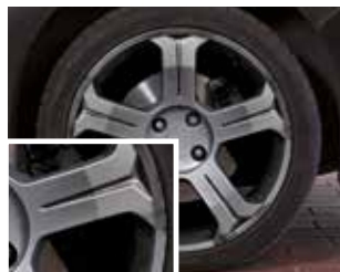
Со стандартными колодками, подвергавшимися торможению