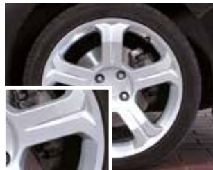
Новый диск, не подвергавшийся торможению

Практическое испытание, проводившееся большей частью в сухих условиях, длилось один месяц на участке в 1560 км. Испытание, проводившееся на испытательном стенде в помещении, длилось 2 дня. Общепринятое в автомобильной отрасли испытание предполагает профиль езды, приближенный к реальному и состоящий из комбинации торможений на городских, проселочных дорогах и на автомагистралях.