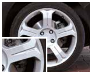
С колодками Jurid WHITE, подвергавшимися торможению

Благодаря ряду проведенных испытаний и достоверных измерений степени оптической плотности почернения колесного диска с помощью колориметра получен результат, столь же объективный, сколь и убедительный: