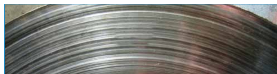
ТАБЛИЦА ОПРЕДЕЛЕНИЯ ПРИЧИН НЕИСПРАВНОСТЕЙ ТОРМОЗНЫХ КОЛОДОК И ДИСКОВ ДЛЯ КОММЕРЧЕСКИХ АВТОМОБИЛЕЙ

ВНЕШНИЙ ВИД Царапины на рабочей поверхности диска. ПРИЧИНА Фрикционный материал колодок слишком грубый для диска или новые колодки были установлены на сильно изношенные диски. РЕЗУЛЬТАТ Снижение эффективности торможения. Возможно проявление нерасчетного распределения усилий при торможении на соответствующей оси. СПОСОБ УСТРАНЕНИЯ • Замените колодки. • Проверьте состояние диска и его минимальную толщину. Если потребуется, замените диск. • Проверьте качество установленных запасных деталей.